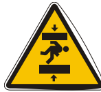
APLASTAMIENTOS DE PERSONAS