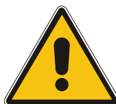
LUGARES DE PELIGRO