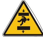
APLASTAMIENTOS DE PERSONAS