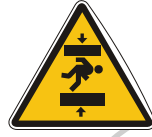
APLASTAMIENTOS DE PERSONAS