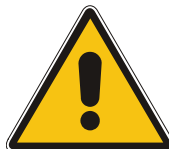
LUGARES DE PELIGRO